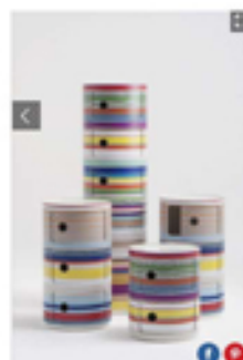
COMPONIBILI COLORATI KARTELL

Lampade disegnate da Kartell al Salone del Mobile 2017