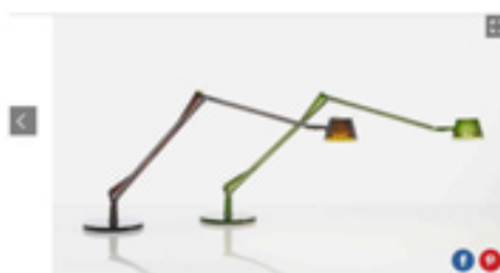
ALEDIN, LAMPADE KARTELL

Nella nostra gallery potrete vedere le novità di Kartell al Salone del Mobile 2017 di Milano.