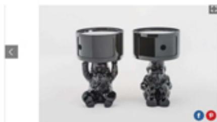
COMPONIBILI DUNE KARTELL

Componibili mini con base a forma di groni di Kartell al Salone del Mobile 2017